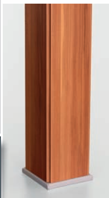
↗ Designově propracovaná noha přidavných stolů

stůl psací + jednací ES 3 200 × 300 × 74