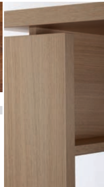
↗ Konstrukce stolu s vynesenou „plovoucí“ deskou