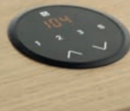
➤ Ovládací panel výškově stavitelného stolu