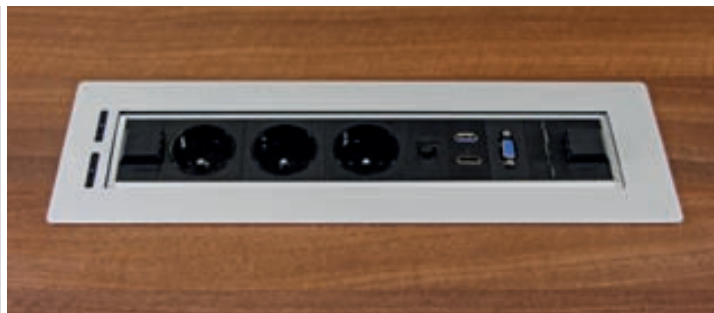
↗ Zásuvkový otočný panel osazený v pracovní desce stolu